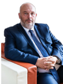
Miroslav Toman ministr zemědělství

Potravinářství a zemědělství patří ke strategickým odvětvím, bez kterých se za žádné situace neobejdeme. Proto se snažíme přijímat cílená opatření na eliminaci budoucích ztrát. Vytvořit zemědělcům a potravinářům takové podmínky a programy, aby byl zajištěn rozvoj do budoucna, kromě jiného zajistit potravinovou soběstačnost obyvatel České republiky. Zemědělci a potravináři jsou pro zvládnutí současné krize důležití. Cením si jejich pracovitosti a zodpovědnosti.